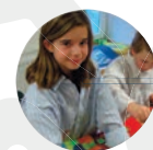
6 Jahre Grundschule