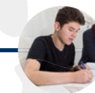
17 Jahre Sekundarstufe II

In unseren sozialpädagogischen Wohngemeinschaften Grabbe-WG und Villa Kronenplatz in Detmold, Haus Ulrich in Büren und Haus Meinulf in Wewelsburg erhalten junge Menschen im Alter von 10 – 21 Jahren die Möglichkeit, in einem überschaubaren, durch Kontinuität, Stabilität und Gestaltungsspielraum gekennzeichneten Rahmen in der Gemeinschaft mit Gleichaltrigen zu leben und zu lernen.