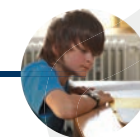
13 Jahre Sekundarstufe I

Unsere Jugendhilfeeinrichtung Schloss Varenholz befindet sich im lippischen Kalletal/NRW. Auf Schloss Varenholz werden junge Menschen im Alter von 10 – 18 Jahren mit Hilfe eines pädagogisch abgestimmten Erziehungs- und Schulkonzeptes in der an die Einrichtung angeschlossenen Privaten Sekundarschule beschult und gemäß Hilfeplanung individuell betreut und gefördert. Das Angebotsportfolio von Schloss Varenholz reicht von der (intensiven) Regelgruppe bis hin zur 5-Tage-Gruppe mit regelmäßigen Wochenend- und Ferienaufenthalten der jungen Menschen in ihrer Familie. Teilstationäre und ambulante Betreuungsformen ergänzen das Angebot.