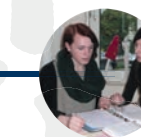
23 Jahre Ausbildung/Studium