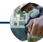
21 Jahre Ausbildung/Studium

Im Rahmen des SBW Lemgo und Detmold wird jungen Menschen im Alter von 16 – 23 Jahren in mehreren Wohngemeinschaften die Möglichkeit geboten, selbständiges Leben zu üben bzw. zu erlernen. Das Sozialpädagogisch Betreute Wohnen bietet sich vor allem im Nachgang zu einer auslaufenden vollstationären Maßnahme in einer der anderen Einrichtungen der Fachinstitute Blauschek an, da die dort begonnene Fallführung ohne Brüche lückenlos fortgesetzt werden kann. Auf Wunsch können wir den Prozess der Verselbständigung über das SBW hinaus zudem in Form von Fachleistungsstunden beim Übergang in eine eigene Wohnung begleiten.